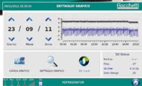
Grafico giornaliero delle temperature con ricerca per data.

Applicativo TUTORIAL: interfaccia integrata per visualizzare in qualsiasi momento i file multimediali utili sia all'utente (video istruzioni e manuale uso e manutenzione) che al service (schemi elettrici, esplosi ricambi).