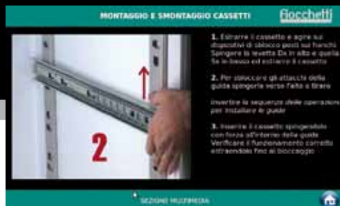
Visualizzazione di video istruzioni per il corretto utilizzo e manutenzione.